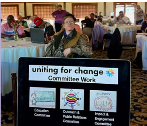
Retiro directivo de Uniting for Change

En 2022, el colectivo de liderazgo de Uniting for Change se centrará en hacer crecer las redes locales de auto defensores y aliados y simpatizantes mediante la creación de conciencia, interés, participación, compromiso y liderazgo dentro del movimiento de auto defensores. ¡Estas redes harán avanzar las prioridades del cambio con voces que SE ALZARÁN y HABLARÁN!