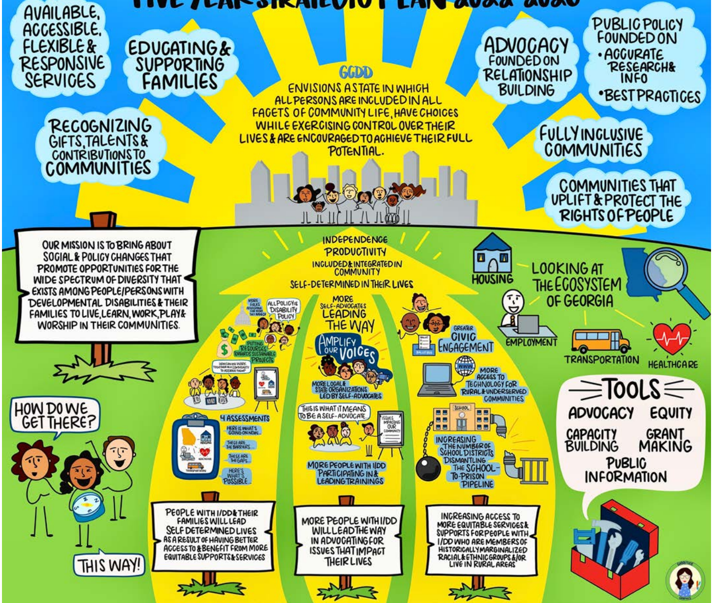
Esta infografía fue creada por Gabby Melnick y es para mostrar el plan en un formato visualmente agradable y simplificado.

a personas con discapacidades físicas, adultos mayores, personas pobres, personas con problemas de salud mental, personas que viven en comunidades rurales y otros trabajando para crear un cambio social que resulte en una mejor Georgia para todos. Finalmente, significa apoyar políticas públicas coherentes mediante el análisis y la defensa que apoyen a las personas con discapacidades